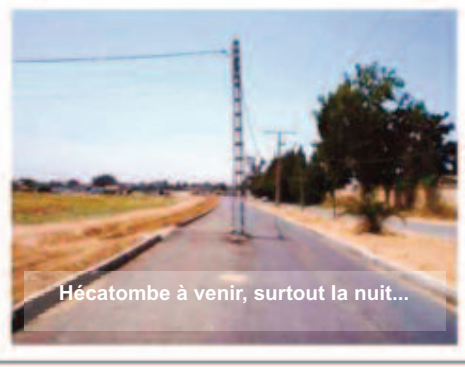
Hécatombe à venir, surtout la nuit...