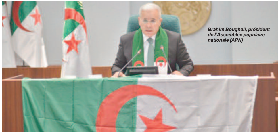
Brahim Boughali, président de l'Assemblée populaire nationale (APN)

Lors d'une séance plénière dédiée à la présentation de ce texte, les responsables parlementaires ont unanimement exprimé leur soutien aux dispositions prévues, soulignant que la loi ne se limitera pas à une simple qualification juridique. Selon eux, elle est "essentielle pour la préservation de la mémoire nationale" et vise à obtenir la reconnaissance et des excuses pour les crimes commis durant 132 ans d'occupation. Les interventions ont rappelé la gravité des actes perpétrés par l'occupant français : massacres, déplacements forcés, famine, expropriation des terres et tentatives d'effacement de l'identité nationale. "Ce lourd héritage colonial ne peut être dépassé ni par le silence ni par l'oubli", ont insisté les présidents des groupes parlementaires, soulignant que la loi constitue une réponse à l'impunité historique et un moyen de consolider la justice pour le peuple algérien. Le président de l'APN, M. Brahim Boughali, a précisé que cette initiative "s'inscrit dans une vision nationale globale visant à renforcer la souveraineté nationale, à conforter la