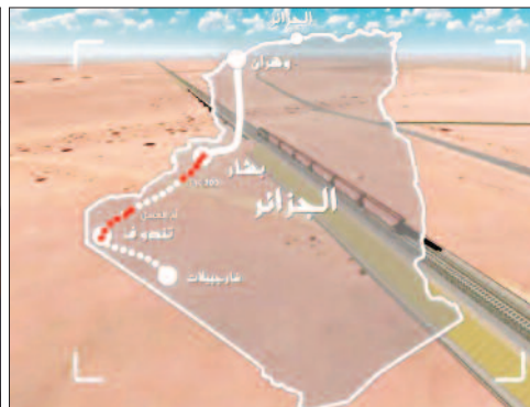
Le chef de l'Etat annonce l'entrée en activité imminente de plusieurs mégaprojets

Gara Djebilet, dans la wilaya de Tindouf (sud-ouest de l'Algérie), est en passe de devenir l'un des projets industriels les plus importants du pays depuis son indépendance.