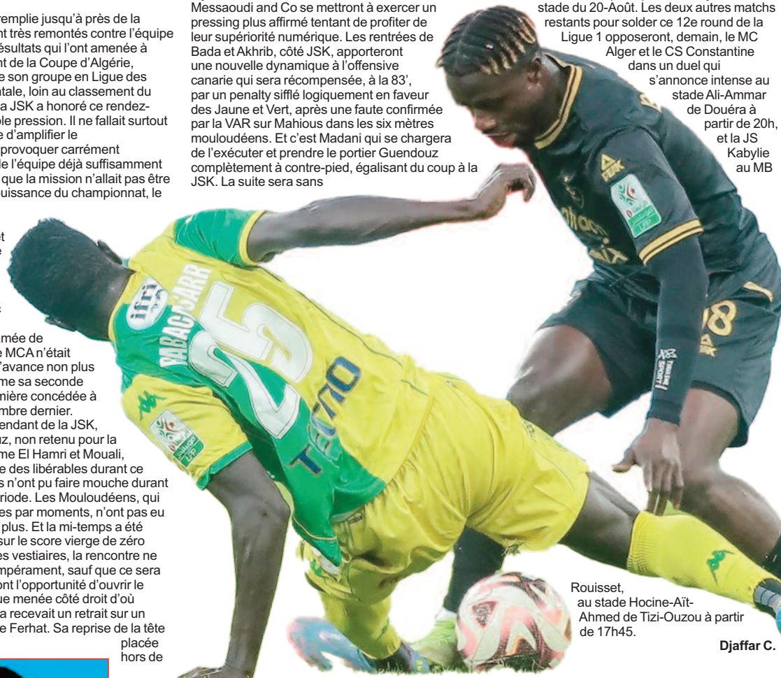
Rouisset, au stade Hocine-Aït-Ahmed de Tizi-Ouzou à partir de 17h45.

s'annonce intense au stade Ali-Ammar de Douéra à partir de 20h, et la JS Kabylie au MB