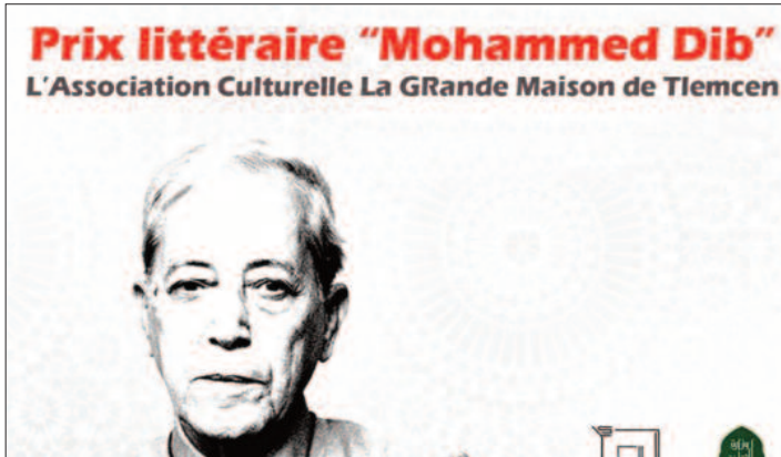
Prix littéraire "Mohammed Dib" L'Association Culturelle La Grande Maison de Tlemcen

de 14h30 à 17h30, à l'exception du vendredi et du samedi. Les envois postaux devront être effectués sous pli recommandé, le cachet de la poste faisant foi. Le dossier de candidature doit comprendre une demande de participation manuscrite, signée et scannée, une fiche signalétique détaillée de l'auteur, un curriculum vitae mettant l'accent sur le parcours littéraire, un descriptif d'une page de l'œuvre proposée, ainsi qu'une photo récente du ou de la candidat(e). Chaque auteur ne peut concourir que dans une seule catégorie linguistique. Les œuvres seront évaluées par le Conseil du prix sur la base de leur valeur littéraire et esthétique, ainsi que de leur contribution au rayonnement de la littérature algérienne, conformément au règlement intérieur. Pour rappel, la cérémonie de remise des prix de la 9 e édition s'est