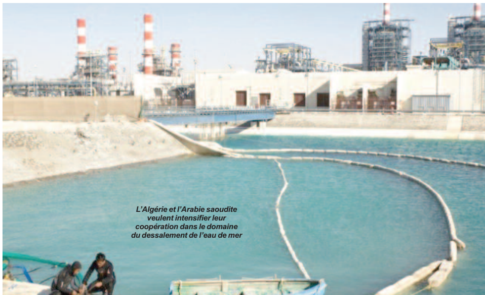
L'Algérie et l'Arabie saoudite veulent intensifier leur coopération dans le domaine du dessalement de l'eau de mer

Entre Alger et Riyad, le temps n'est plus aux simples amabilités diplomatiques, mais à la construction d'un axe stratégique de premier plan. Alors que les deux géants énergétiques du monde arabe multiplient les accords économiques — de l'agro-industrie à la pêche maritime — cette lune de miel cache des enjeux bien plus profonds. Entre sessions de haut niveau et convergence sécuritaire, ce rapprochement prend des airs de rempart. Dans une région en pleine recomposition, Alger et Riyad semblent décidés à reprendre la main sur leur destin commun.