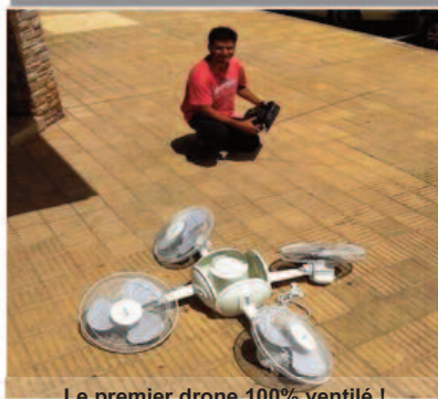
Le premier drone 100% ventilé !