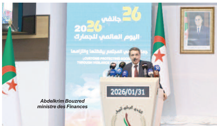
Abdelkrim Bouzred ministre des Finances