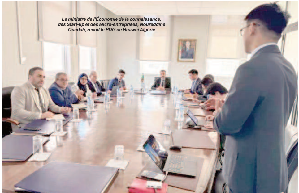
Le ministre de l'Économie de la connaissance, des Start-up et des Micro-entreprises, Noureddine Ouadah, reçoit le PDG de Huawei Algérie

La rencontre a également permis d'examiner les mécanismes susceptibles de favoriser l'émergence de technologies développées localement dans le