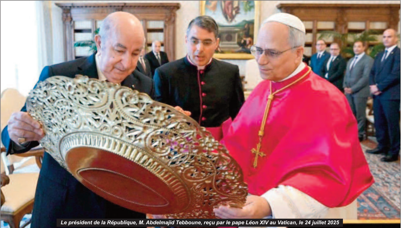
Le président de la République, M. Abdelmajid Tebboune, reçu par le pape Léon XIV au Vatican, le 24 juillet 2025

La venue du pape Léon XIV en Algérie, prévue du 13 au 15 avril, s'annonce comme un événement inédit et hautement symbolique, marquant une étape importante dans les relations entre le Saint-Siège et Alger. Pour la première fois de l'histoire, un souverain pontife effectuera une visite officielle dans le pays dans une démarche placée sous le signe du dialogue entre les cultures, du rapprochement entre les religions et de la promotion des valeurs universelles de paix et de coexistence.