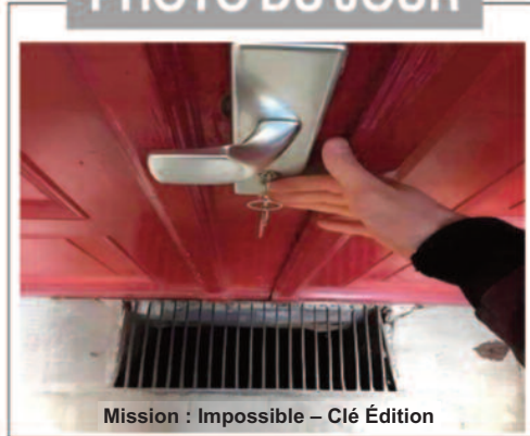
Mission : Impossible – Clé Édition