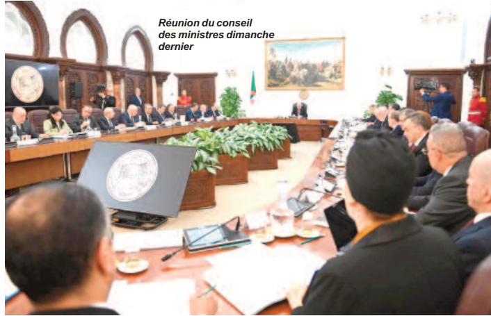
Réunion du conseil des ministres dimanche dernier