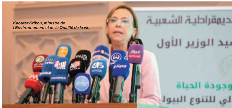
Kaouter Krikou, ministre de l'Environnement et de la Qualité de la vie

Mme Krikou a précisé que cela implique de définir précisément la fonction de chaque secteur et partenaire impliqué, tout en réunissant les ressources matérielles et humaines pour une mise en œuvre