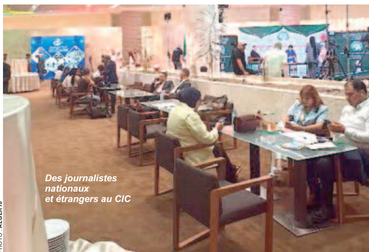
Des journalistes nationaux et étrangers au CIC